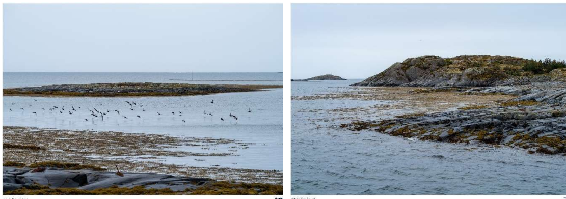
Bilder fra søndre del av eksempelområdet.

Det er tidels åpent farvann sør og vest for Vega. Farvannet sørvest, sørøst og nord for Vega omfatter flere grunne områder, med skjær og skvalpeskjær. Farvannet fra Bremsteinen-Vega og nordover til Ytre Flesan er særlig urent, og praktisk talt ufarbart for fremmede. Unntatt er leia fra Vega til Bremsteinen, som er oppmerket (Den norske los).