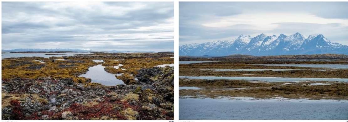
Bilder fra nordre del av eksempelområdet.