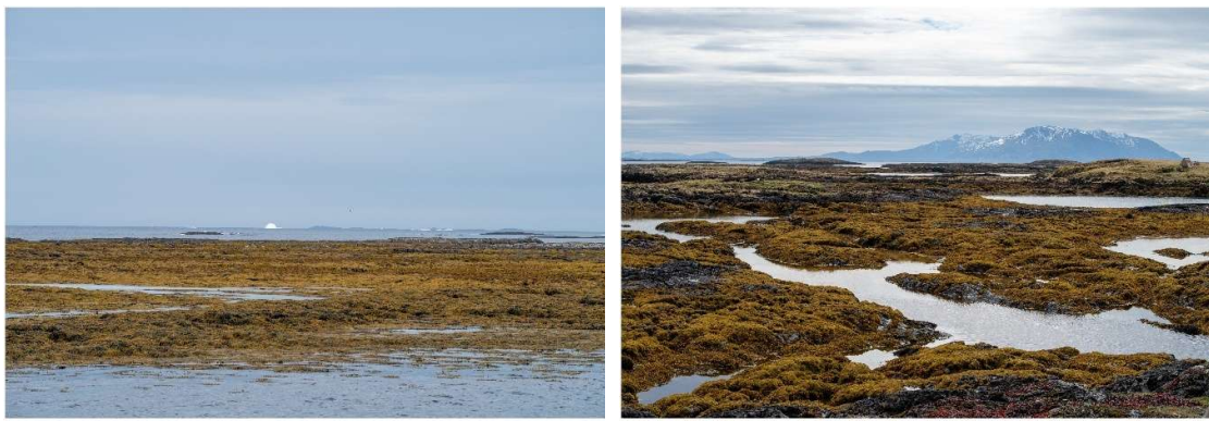
Eksempler på områder som påvirkes av tidevannsvekslingen.

Midlere lavvann for eksempelområdet er 79 cm, mens midlere høyvann er 245 cm ( www.sehavniva.no , Kartverket). Tidevannsforskjellen på 1.7 meter gir stedvis sterke tidevannsstrømmer. Midlere sjøtemperatur er lavest i vårsesongen (6 °C i mars) og høyest i sommersesongen (13 °C i august).